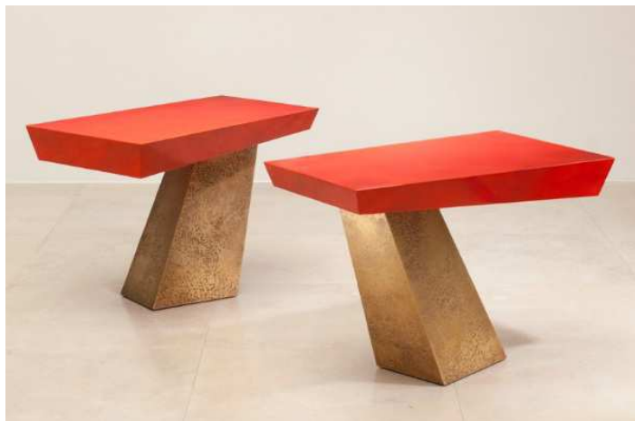
Bout de canapé "Inclinaison"