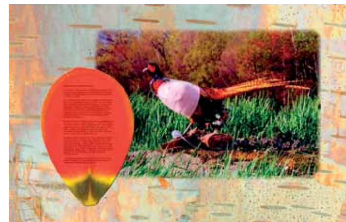
Adam Zaretsky, 'Letter to the prince', 2008. Courtesy Verbeke Gallery, Antwerpen. Prijs: € 5000.