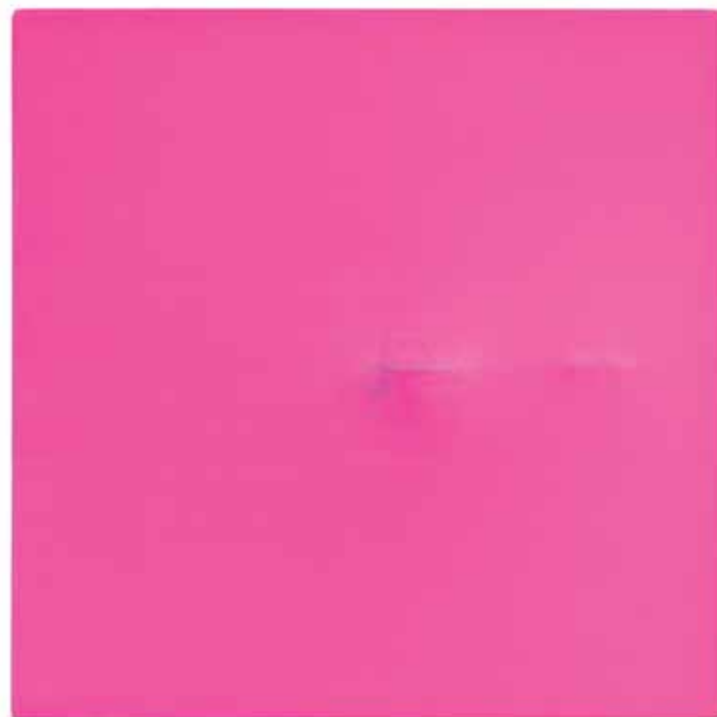
'De (kleine) rode berg', 36 x 36 cm, 2011. © kunstenaar / Galerie Faider.

Le Salon d'Art Munthofstraat 81 Brussel t/m 24-12 www.lesalondart.be