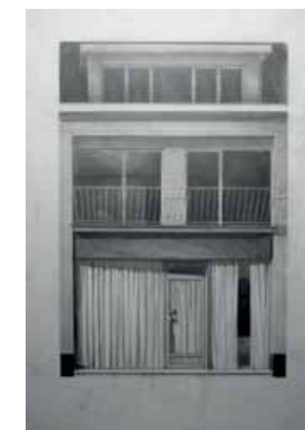
Bruno Hardt, 'Façade', 2011, potlood op papier, 100 x 140 cm. © Bruno Hardt. Prijs: € 2120.

De opmars van de tekenkunst als volwaardige kunstvorm is niet te stuiten. CypresGalerie verzamelt een twaalfstal kunstenaars uit België en Nederland in 'The Draughtsman's Contract'. Met de gelijknamige film van Peter Greenaway in het achterhoofd wordt nagegaan hoe het landschap en de architectuur vandaag rondwaren in autonome tekeningen. Soms is het een combinatie van beide: Greet Van Autgaerden gaat aan de slag met kampen die worden gebouwd in de natuur. Vaak wordt het papierverbruik de hoogte ingejaagd met grote formaten. Zo ontwerpt de jonge Nederlander Rik Smits imaginaire steden, fabelachtige metaforen van onze maatschappij. De Nederlandse sterkenkunstenaar Marcel van Eeden houdt het bij kleine zwart-wit tekeningen om de periode voor 1965, zijn geboortjaar, te exploreren. Andere deelnemers zijn onder meer Peter De Koninck, Stefan Serneels, Hannelore Van Dijck en Robbie Cornelissen. (cv)