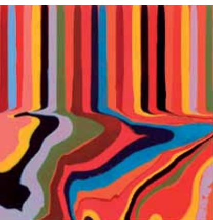
Ian Davenport, 'Bright Red Etching', 2011, uit de set 'Colourplan Series', vier gekleurde etsen, 83 x 80 cm, editie van 30. Prijsindicatie: tussen € 1500 en € 3600.

Sinds september wakkert Eastmen Gallery in Hasselt de aandacht aan voor actuele kunst. 'Very British' introduceert zes Britse kunstenaars wier werk zelden of nooit is te zien in België. De nestor van het gezelschap is Michael Craig Martin. Hij