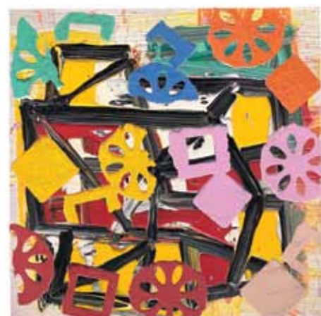
Zonder titel, olieverf op papier, 2010. © kunstenaar. Ongeveer € 3.400 voor een werk van formaat 46 x 61 cm.

Yves Zurstrassen is een autodidact die in zijn experimenten altijd zijn eigen weg volgt. Zijn oeuvre getuigt van intensiteit en engagement. Zurstrassen schildert het liefst in de beslotenheid van zijn atelier. Aan contacten met de buitenwereld heeft hij gewoon geen behoefte. Tot nu toe heeft hij al meer dan duizend werken geschilderd. Sinds een tiental jaar geeft hij zijn schilderijen als titel de datum waarop ze zijn gemaakt. Een van de constanten in zijn oeuvre is muziek. Die loopt als een rode draad door zijn werken. De muziek brengt hem ertoe ingehouden emoties te uiten en is ook een inspiratiebron voor zijn schilderijen. Het is trouwens geen toeval dat er in de muziekterminologie zoveel woorden voorkomen die aansluiten op de schilderkunst, en al zeker op die van Zurstrassen. Enkele jaren geleden al bedacht hij zijn schilderijen met korte namen als 'Variatie', 'Ouverture', 'Fragmen-