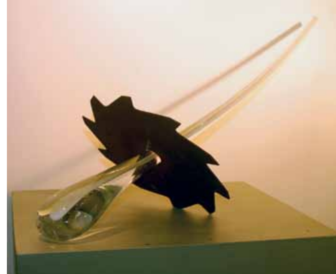
Carine Delecour, 'Doorboord', sculptuur van staal en kristal, 28 x 72 cm. Prijs: van € 500 tot 1.500.