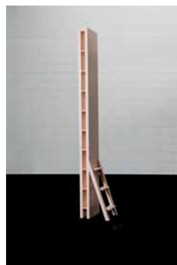
Fabrica, 'Objet préféré - Libri', 2011. Prijsindicatie: tussen € 3000 en € 7500 per stuk, gelimiteerde editie van 5 exemplaren die met de hand worden vervaardigd in de ateliers van Grand-Hornu.