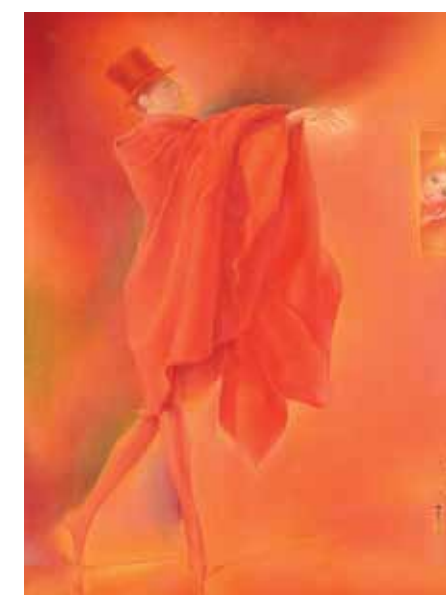
'Le Porteur de Sortilège / De betoveraar', ca. 1970, olieverf op doek, 80 x 60 cm. © serge.vivian.miessen.

Bellor is een pseudoniem voor René Miessen (Aarlen, 1911 – Brussel, 2000), een discrete en geheimzinnige kunstenaar. Ongewild slaagde hij erin zich los te maken van het dagelijkse, om zich volledig aan de kunst te wijden en er helemaal in op te gaan. Bellor had evenveel talent als zijn tijdgenoten (Magritte, Delvaux e.a.), met wie hij trouwens vaak werd vergeleken, maar hij had niet diezelfde mateloze ambitie. Met een tijdloos perfectionisme beproefde hij de traditionele technieken. Hij legde verschillende glacis op zijn doeken, een langzame methode die uiterste nauwkeurigheid en veel geduld vergde. Net hierin was Bellor een uitbinker. Hij hechtte enorm veel belang aan de kwaliteit van de weergave. Met sprekend gemak schakelde hij over van inkt naar pen, van gouache naar olieverf. Het resultaat is een parallele wereld, bevolkt door zonderlinge, zo niet beangstigende wezens, in de meest onverwachte situaties. Een hoogst origineel oeuvre, met meesterlijke hand tot