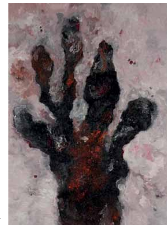
Armando, 'Die Hand 15.10.10', 2010, olieverf op doek, 220 x 160 cm. © Armando. Prijs: € 36.500.

CypresGalerie Vaartstraat 131 Leuven 11-12 t/m 05-02 www.cypresgalerie.be